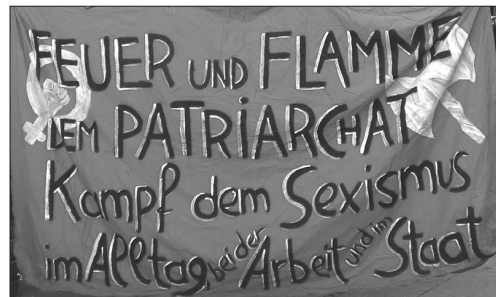
Eines der Transparente bei der Protestkundgebung „Einzug statt Aussperrung“ am 13. April 23 und beim FZ-Infotisch am internationalistischen 1. Maifest 23 im Sigmund Freud-/Refugee-Park

Das Gebäude existiert heute nur deshalb, weil