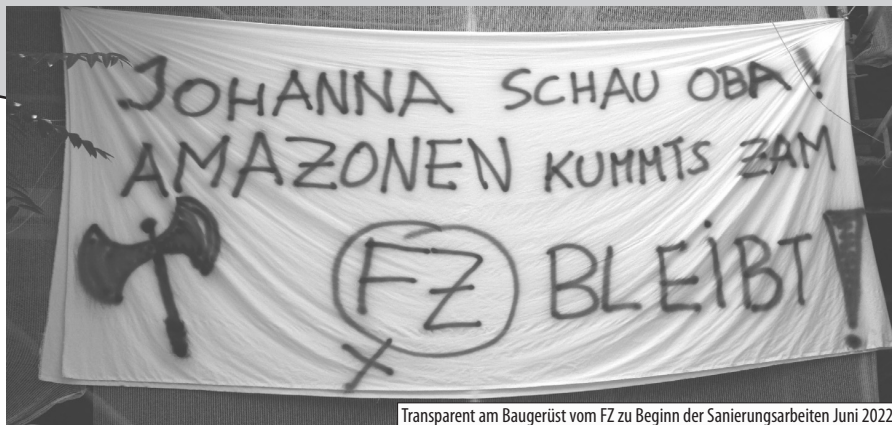
Transparent am Baugerüst vom FZ zu Beginn der Sanierungsarbeiten Juni 2022

Aktuell: Für die Generalsanierung des denkmalgeschützten Gebäudes, u.a. für den notwendigen barrierefreien Zugang, forderte die Stadt Wien einen Mietvertrag, der unter Geheimhaltung zwischen WUK und Stadt Wien verhandelt wurde. 2020 hat das WUK auf Druck der Stadt Wien einen befristeten Mietvertrag nicht nur über die Räumlichkeiten des WUK, sondern unrechtmäßig, gegen den Willen und trotz anhaltender Proteste des FZ, auch über die Räum-