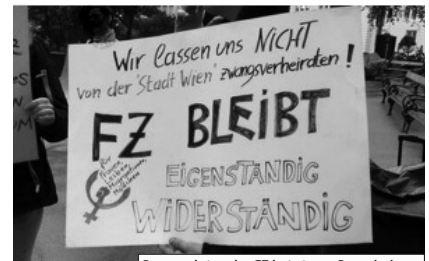
Protestaktion des FZ bei einem Besuch des „Punschstandes“ der Stadträtin Gaál Dez. 19